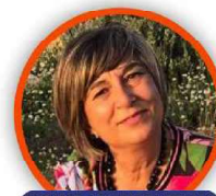
GIOVANNA MARIA BURRELLI SCUOLA PRIMARIA