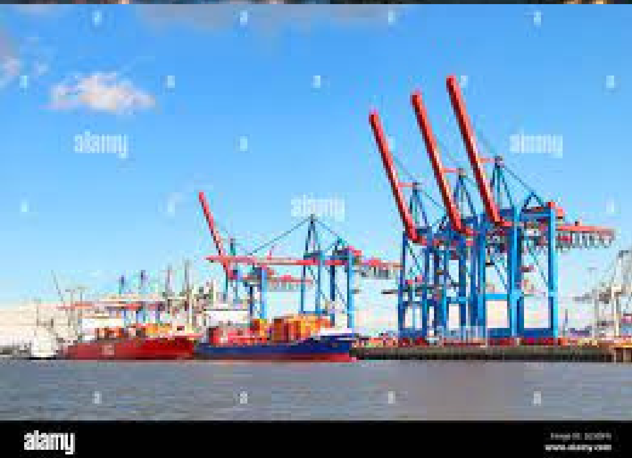
Porto sul fiume Elba

Il porto, che sorge sul fiume Elba, è l'elemento principale della città e uno dei porti più importanti della Germania .